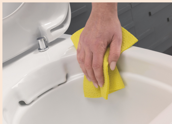
Dépourvue de bride, la cuvette de WC est d'un entretien on ne peut plus facile : un simple coup d'éponge redonne éclat à la porcelaine.

Afin d'assurer le fonctionnement des cuvettes de WC, la conception du bol fait traditionnellement appel à une bride, sorte de languette qui tombe vers l'intérieur : qu'elle soit ouverte, pincée ou fermée, elle a pour rôle de répartir l'eau de la chasse entre l'avant de la cuvette (rinçage) et le siphon (évacuation des matières). Outre que la mise au point d'un tel élément est d'une grande complexité, la bride de cuvette peut constituer, au fil des ans, un refuge pour les germes et autres bactéries.