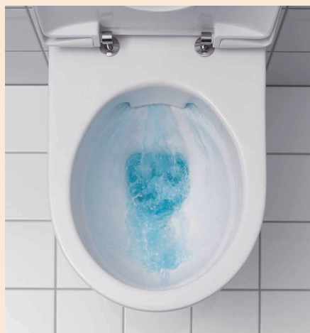
Efficacité de la chasse et rinçage du bol sont optimisés.

Afin d'assurer le fonctionnement des cuvettes de WC, la conception du bol fait traditionnellement appel à une bride, sorte de languette qui tombe vers l'intérieur : qu'elle soit ouverte, pincée ou fermée, elle a pour rôle de répartir l'eau de la chasse entre l'avant de la cuvette (rinçage) et le siphon (évacuation des matières). Outre que la mise au point d'un tel élément est d'une grande complexité, la bride de cuvette peut constituer, au fil des ans, un refuge pour les germes et autres bactéries.